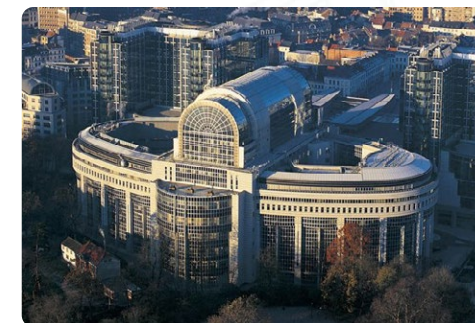
Le Parlement européen à Bruxelles